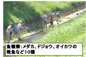
魚観察：メダカ、ドジョウ、オイカワの 種魚など10種