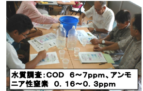
水質調査：COD 6～7ppm、アンモニア性窒素 0.16～0.3ppm

発行者・問い合わせ：NPO法人やましろ里山の会 電話FAX:0774-64-4183 メール:fddb257@ybb.ne.jp