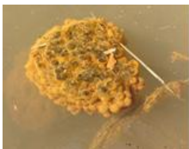
5 号地で見つけた赤ガエルの卵

里山展(京田辺市立中央図書館、3 月 3 日～8 日まで)も開催していて、農園には 4 人と少ないながらも参集してくれました。農園内の水たまり(湿地?)などを中心とした生き物探し、2 号地では草引きや牛糞を撒いて土づくりを行いました。また、16 号地に敷設されていたマルチの撤去も行いました。農園内の散策では、ニホンアカガエルの卵(4 号地)やウサギの糞(2 号地)、キクラゲ(1 号地近く)を見つけることができました。これから暖かくなるにつれて、多くの生き物が登場してきそうだなと思わせるような午前中でした。