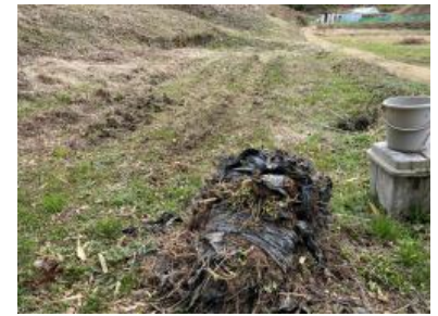
マルチの撤去(16 号地)