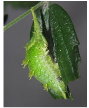
5月4日時点 6 齢幼虫