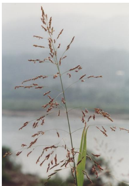
セイバンモロコシ