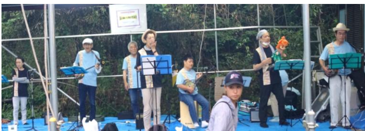
キジューバンドの熱演が続きました

なぜ光を出せるのか おしりに近い部分には、黄色に「発光器」というものが vh&jkl 、あります。その中には「ルシフェリン」という発光する物質（ぶっつ）と、発光するのを助ける「ルシフェラーゼ」という「こう素(そ)※」があります。この2つの物質とホタルが体の中にとりこんだ酸素(さんそ)が反応をおこして光を出す。 参加者募集中 夏の昆虫観察会7月4日 夜の昆虫観察会7月25日 申し込みください・里山の会