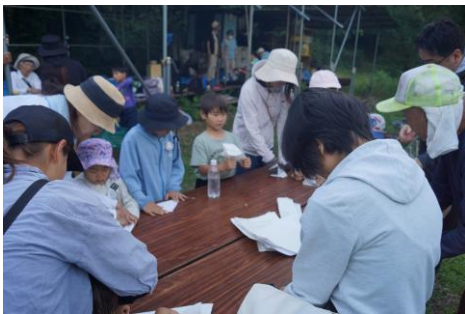
紙飛行機を折りました

たプログラムで約 60 分間引き込まれました。ホテルが飛翔する時刻に合わせて場所を炭焼小屋付近に移動して蛍の飛翔を待ちました。この日の暑さは蒸し暑さがなかったのですが期待していたほど蛍の飛翔は弱く少し残念な状況でした。スタッフの皆さん朝から準備を進めていただきましてありがとうございました。