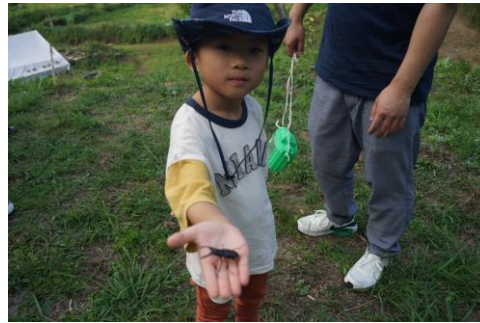
お父さんとノコギリクワガタを見つけました