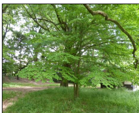
樹形が美しいカツラ