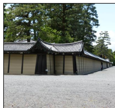
御所の鬼門 猿ヶ辻