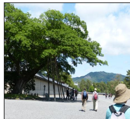
清水谷家のムクの巨木 大文字山を望む