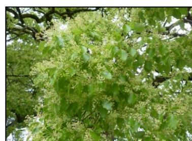
くすのき 花盛りです