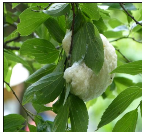
モリアオガエルの卵