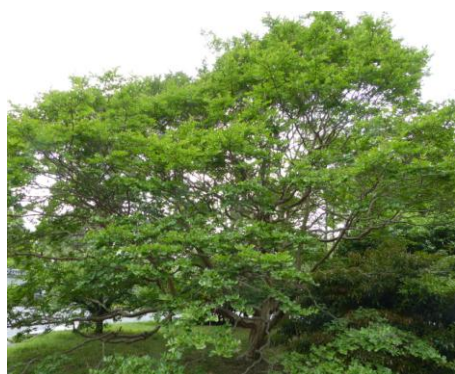
サルスベリの巨木