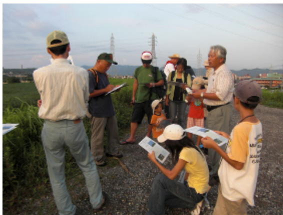
18:26 山村レンジャー開会の挨拶