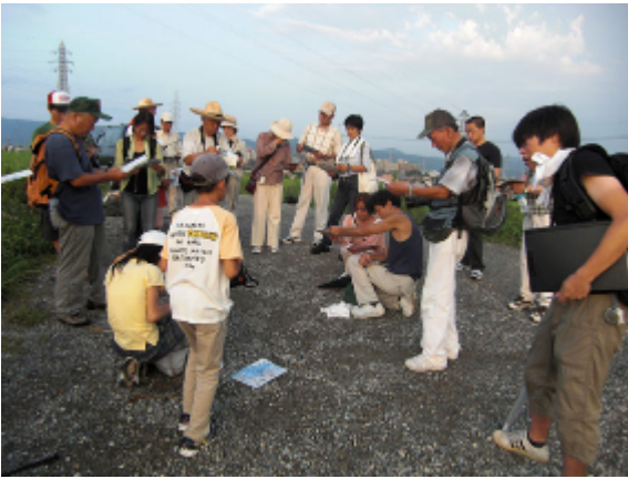
18:29 菊井レンジャーによるねぐら入りの説明