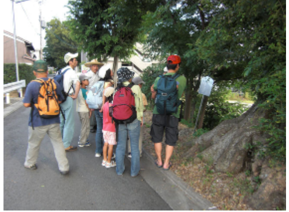
17:13 西目川の太閤堤遺構