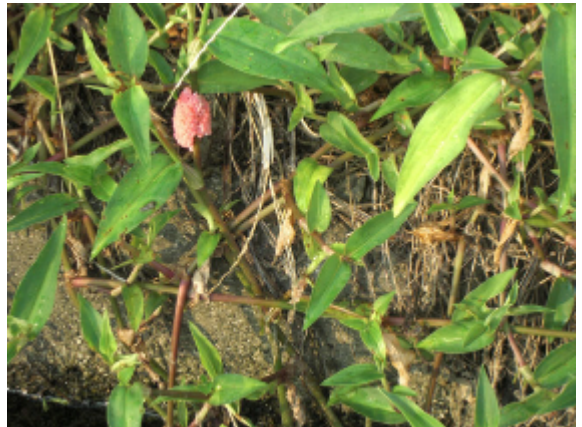
17:44 スクミリングガイ(ジャンボタニシ)の産卵