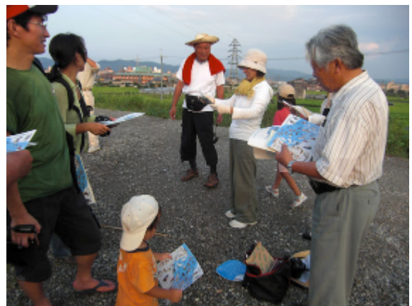
18:24 ねぐら観察地到着、資料配付