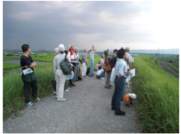
18:50 調査地点観察の開始