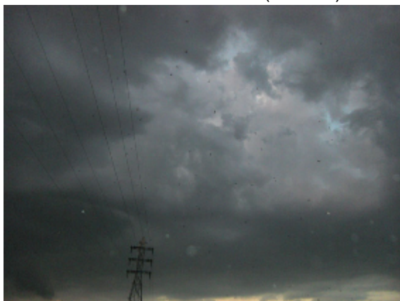
19:05 ねぐら入りのようす(3の3)