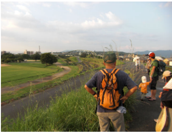
18:01 遠景伏見桃山城の説明