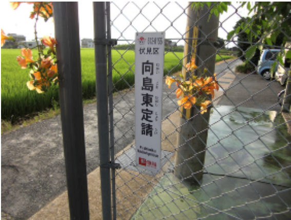
17:36 珍しい地名。東定請(ひがしじょううけ)