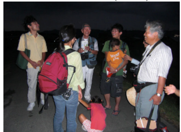
19:08 スタッフ解散と両レンジャーの挨拶