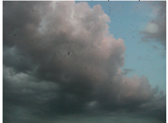
19:04 ねぐら入りのようす(3の2)