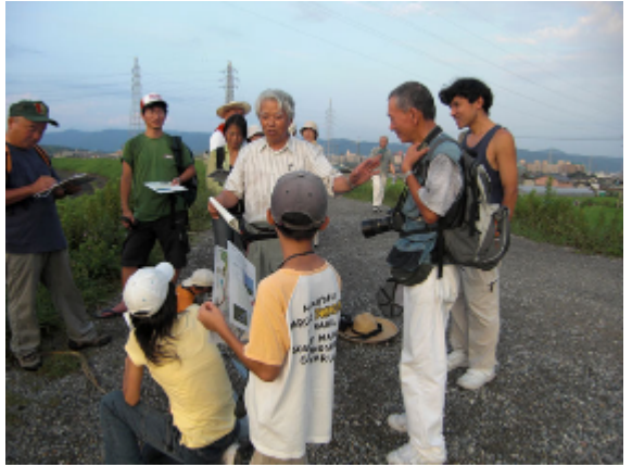
18:26 菊井レンジャーの合流と挨拶