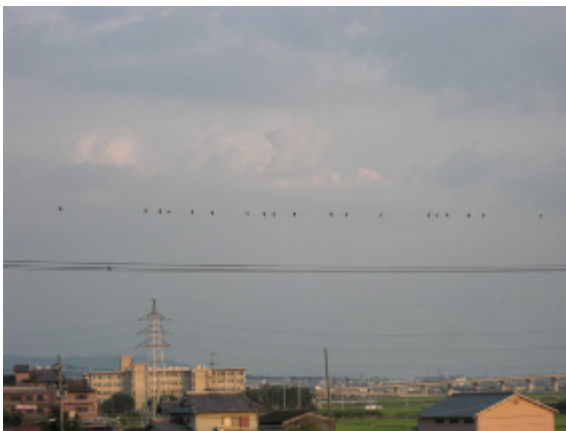
18:10 カワラヒワ 22羽確認