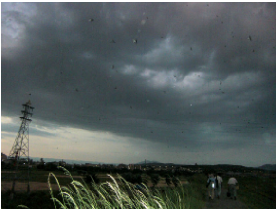
19:04 ねぐら入りのようす(3の1)