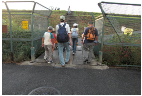
18:00 堤防入り口に到着