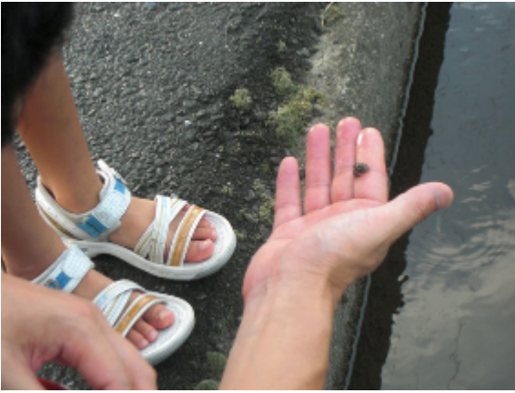
17:47 水路での小さなカニ