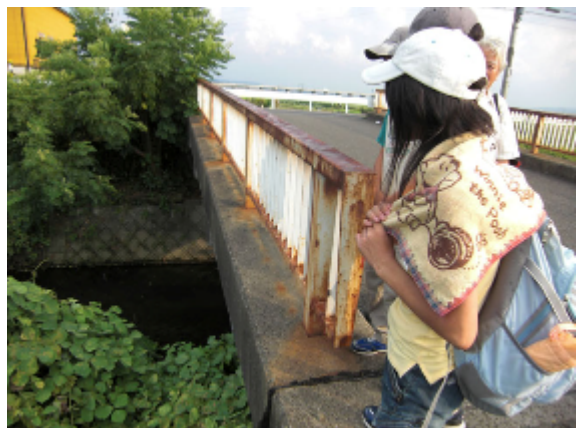
17:32 河川と水路の立体交差