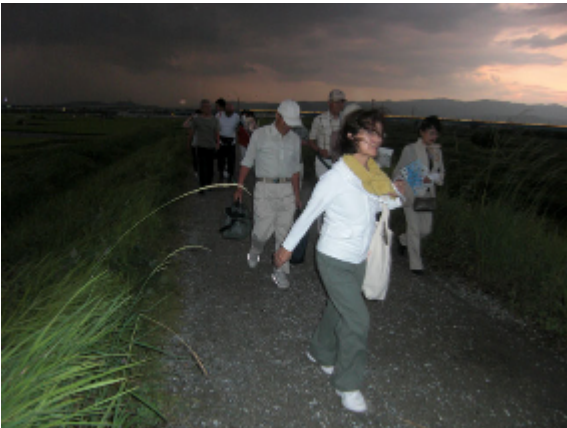
18:56 天候急変により急遽散会