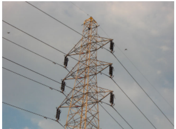
18:10 ハヤブサ・チョウゲンボウ計3羽確認