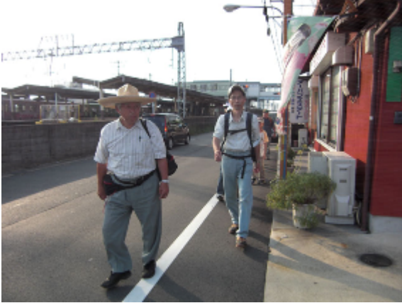
17:09 事前現地見学移動