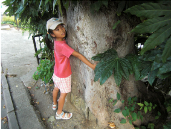
17:15 棕の木。巨棕池の名前の由来